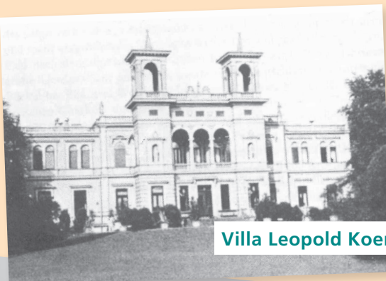
Villa Leopold Koenig 1880