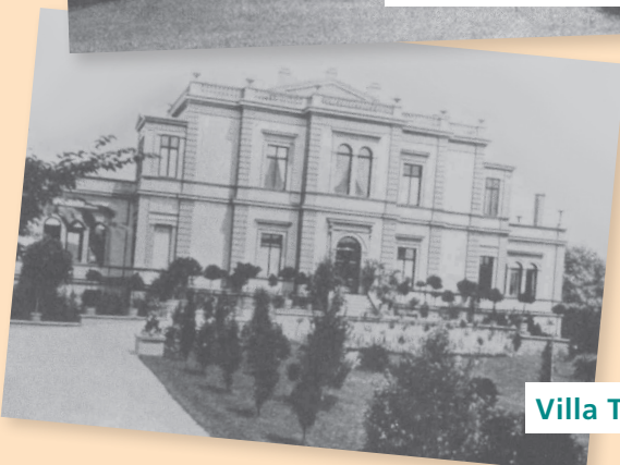
Villa Troost 1867