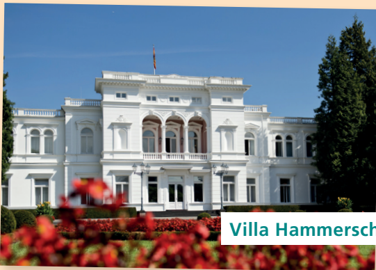
Villa Hammerschmidt 2020

Verbinde die Bilder mit der richtigen Stelle auf dem ZEITSTRAHL. Trage anschließend dein Geburtsjahr auf dem Zeitstrahl ein.